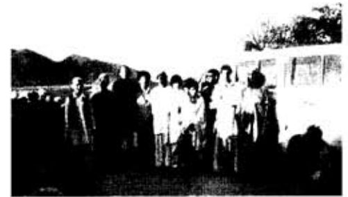
Arbeitsstart des ARC Austrian Relief Committee for Afghan Refugees im Lager Gandaf/Pakistan, 1980