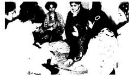
ARC-Näherwerkstatt für afghanische Flüchtlingsfrauen, 1984