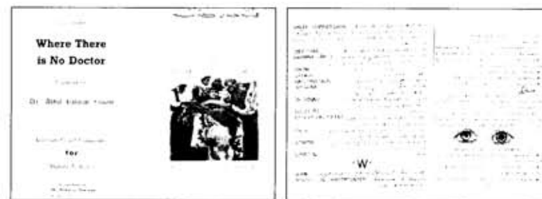
Medizinisches Selbsthilfehandbuch des ARC in den Landessprachen

In Afghanistan selbst musste erst ein Netz von Vertrauensleuten aufgebaut werden, bevor Schritt für Schritt Beiträge zum Wiederaufbau, Agrarvorhaben oder ärztliche Stationen realisiert werden konnten. In den inten-