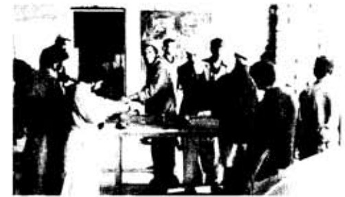
Technische Lehrwerkstätte des ARC, 1991

tadschikischer und turkomanischer Sowjetsoldaten mit den Mudschaheddin gleicher ethnischer Zugehörigkeit“. 11